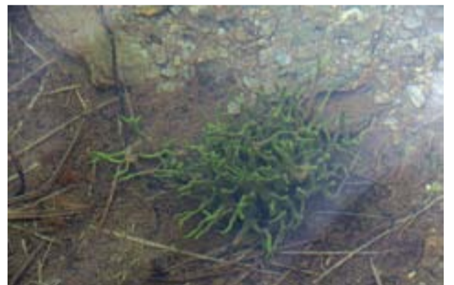
Загадка озера - губка (животное) или водоросль

В декабре 2020 г. комиссия по Красной книге при Министерстве экологии и природных ресурсов утвердила новый перечень Красной книги Красноярского края. Для парка «Ергаки» есть «новости». Из дополнительно внесенных видов - Лук алтынкольский, Бодяк Комарова, Ястребинка Верещагина, Бубенчик Голубинцевой, Звездчатка Золотухина, Родиола розовая, Володушка тушканчик и много других. В то же время из списка убраны отдель-