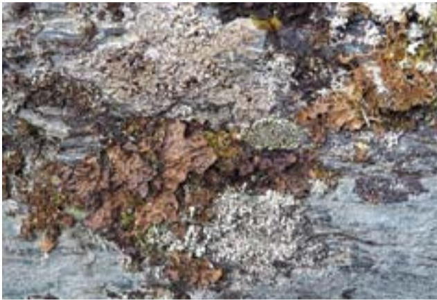
Новая находка для этих мест - Лобария сетчатая КК РФ

было единственное местонахождение и в Красноярском крае. Дополнительные местонахождения, которые указываются в Красной книге для Боруса и Восточного Саяна - не подкреплены доказательными для тех, подходящих условий. Конечно, это печальное событие случилось до создания парка, но острота проблемы не «стареет». Прекратить уничтожение редких видов, как и предотвратить это в самом начале бывает непросто. Несмотря на формальную сторону закона, защищающего наши редкости, на практике применить эту защиту непросто. Во-первых, нарушителей гораздо больше,