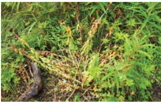
Гигантский золотой корень - рекордсмен вида

Красная книга Красноярского края - местное издание, она имеет статус официального документа, является частью закона края о Красной книге. Видов, внесенных в этот документ для парка, приводится 163 вида растений, грибов, лишайников. Но больше всего семенных растений - 110 видов. Сказать «очень много» - это ничего не сказать. Ергаки - один из центров биологического разнообразия и только поэтому требуют очень аккуратного, бережного, взвешенного отношения. Многие редкие виды известны тут из одного местонахождения. Один взмах ковша экскаватора - и нет места, нет вида. К сожалению, такие примеры есть. В 80-е годы при строительстве «Новой дороги» в районе Полки было уничтожено единственное местонахождение редкого лишайника из Красной книги РФ - Коккокарпии краснодревесной. Вероятно, это