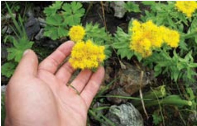
Цветение золотого корня в тундровых скалах

Ну где еще можно увидеть за полтора часовую езду на автомобиле весь ряд климатов от почти океанического до резко континентального - а тут пожалуйста, каждый желающий может посмотреть и испытать на себе. Как следствие этого в Ергаках много редких видов, настолько редких, что внесены они в Красные книги разных рангов и уровней. Важнейшая для нас по статусу - Красная книга РФ. В парке отмечено 30 видов этой категории. Это очень много. Сейчас Красная книга РФ обновляется и, возможно, это количество изменится.