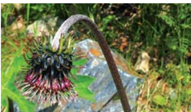
Горькуша Фролова - редкий уникум КК КК

Когда речь заходит о Красной книге, то сложно избежать печальной информации. Даже радость о новых находках видов - несколько двусмысленна: то ли радоваться самой находке, то ли печалиться, что еще один вид стал редким. Размах хозяйственного воздействия на парк - довольно значителен. Тут и федеральная трасса в Туву, тут и инфраструктура ЛЭП, тут и многочисленные туристические базы, тут и возможность постройки железной дороги, тут и изыскатели природных ресурсов, тут и их добытчики. Поэтому приходится прилагать