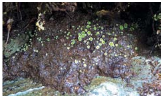
Лишайник Нормандина красивенькая КК РФ

ные виды, которые приводились ошибочно. Так, из Красных книг РФ и Красноярского края убран вид мха Некера северная (приводилась для парка). Полученные новые данные позволили исправить полувекую ошибку. Вместо этого «недоразумения» в число редких попал действительно заслуживающий защиты вид - Левкодон беличий. Это реликт, оставшийся у нас с доледникового периода и напоминающий внешним видом миниатюрный хвост белки. Растет этот мох на скалах и на старых стволах росистых ив. Из новых для парка лишайников в Красную книгу внесены Пармелия азиатская и