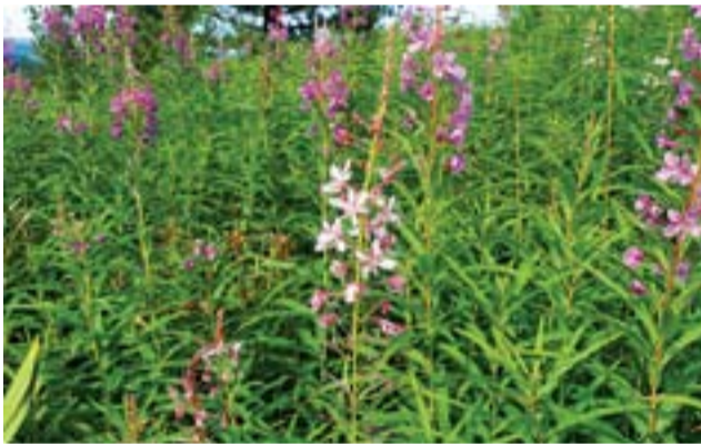
Полубелый иван-чай - что это - мутант или особый подвид

Обычно наибольшую угрозу несет хозяйственное преобразование территории, но и туризм может также вносить свою лепту. Так, в активно посещаемой части парка почти полностью уничтожены Рододендрон Адамса и Золотой корень (Родиола розовая). Последний вид, вынужденно, вследствие этого был предложен в новую версию Красной кни-