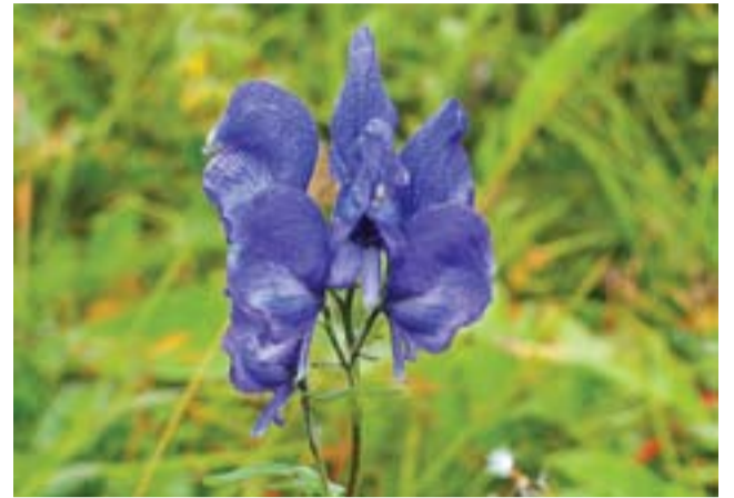
Борец Паско КК РФ

много усилий, чтобы сохранить всё о ценное, что у нас есть.