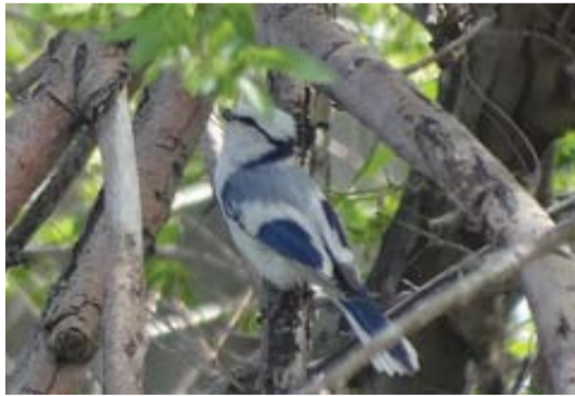
Князёк спрятался в молодой листве.

Все синицы, а их в нашем регионе обитает 8 видов, имеют небольшие размеры, достаточно яркое оперение, очень подвижны и любознательны, зимой держатся вблизи человеческого жилья, каждую весну напоминают о себе пением.