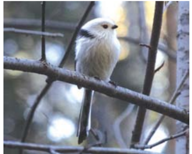
Длиннохвостая синица.

Пары у этих птиц постоянны, либо формируются еще в зимних стайках. Гнездо строят вместе и достаточно долго, почти три недели. Оно хотя и очень большое, но малозаметное, выглядит наростом