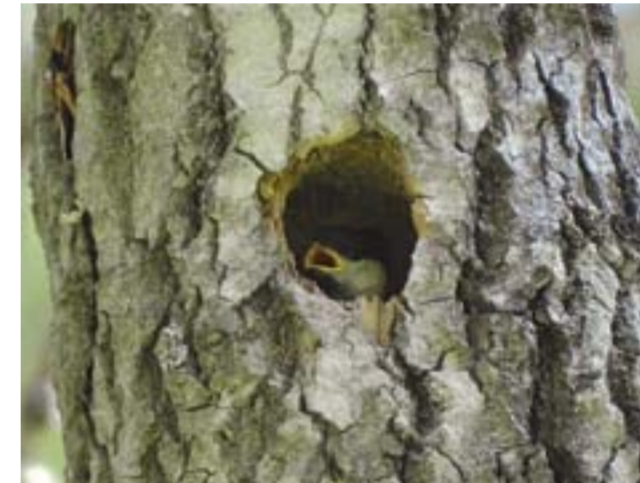
Буроголовая гаичка в дупле дерева.

Большая синица, хоть и выкармливает своих птенцов насекомыми и их личинками, а зимой переходит на семена растений, тем не менее, это самая настоящая хищница. Многие, подкармливая синиц, подвешивают для них кусочек несоленого сала, и