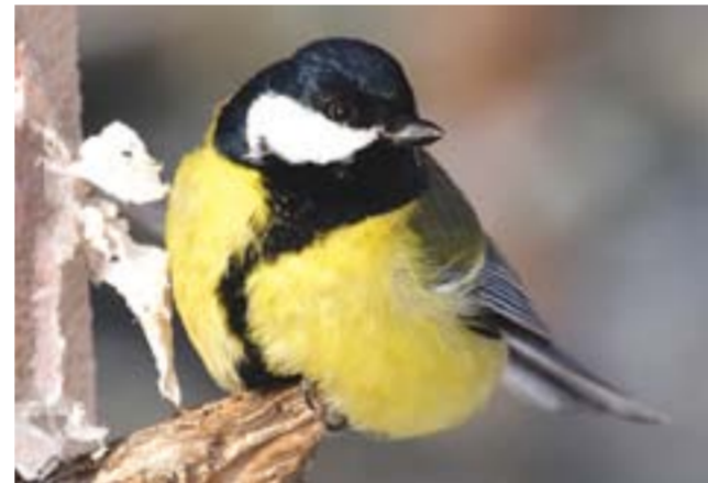
Большая синица.

Пухляк в вопросе гнездования проявляет крайнюю степень самостоятельности. Самец и самка «не ждут милости от природы», а своими небольшими клювиками выщипывают (в прямом смысле этого слова) себе дупло. Задача упрощается, когда им удается найти прелое дерево небольшого диаметра или высокий пенек, чаще лиственных пород. Хотя в настоящее время, когда в нашей тайге так много загубленного короедом (полиграфом уссурийским) сухостойного пихтача, представляющего собой крайне печальное зрелище, гаички спокойно гнездятся и там. Подготовка дупла - дело не быстрое, и занимает от недели до трех, в зависимости от степени твердости древесины.