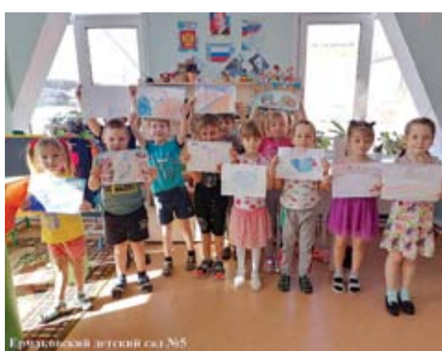
Ермаковский детский сад №5