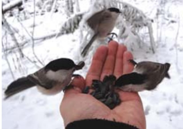
Буроголовые гаички. Птицы легко приучаются брать корм с руки.

Происхождение слова синица - звукоподражательное, от звуков «зинь», которые издают эти птахи. Постепенно «зинька», «зиница» просто трансформировалась в «синицу», поэтому искать синие оттенки в оперении наших синичек смысла не имеет. Хотя, если в любом правиле есть исключения, то почему бы ему не быть и среди синиц. Например, лазоревки - синички весьма оригинальной расцветки, глядя на которых, не возникает никаких сомнений в правильности звучания современного названия этого семейства. Для тех, кто не в курсе, поясним, лазоревый цвет - это темно-голубой. Настоящие лазоревки живут намного западнее, а в нашей местности, хоть и не часто, но можно встретить белую лазоревку, называемую еще князёк Parus