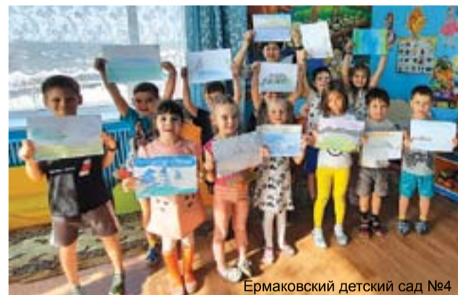
Ермаковский детский сад №4