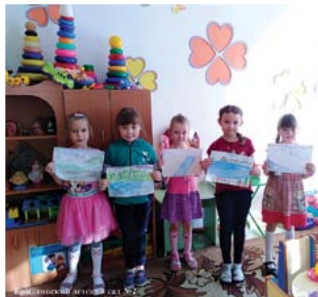
Ермаковский детский сад №2