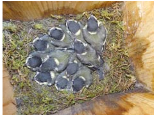
Птенцы большой синицы в скворечнике.

виком ловко расправляется с кедровыми орешками, которые, кстати, самостоятельно из шишки достать не может и, конечно же, нуждается в помощи.