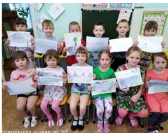
Ермаковский детский сад №3