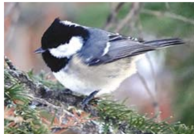
Чёрная синица или московка.

Питаются взрослые гаички мелкими беспозвоночными: тлей, мягкими гусеницами, пауками, их коконами, ими же выкармливают и птенцов. Зимой питание становится более разнообразным. Различных личинок, куколок и яйца насекомых пухляки разыскивают на стволах деревьев, ветвях и в хвое. Диета разбавляется семенами хвойных деревьев и других растений. Устраивают мелкие тайники, куда прячут всего по одному семечку, причем, как это ни удивительно, но они помнят обо всех своих «зачках». Птицы легко приучаются брать корм с руки. Трудно поверить, но эта кроха с мельчайшим клю-