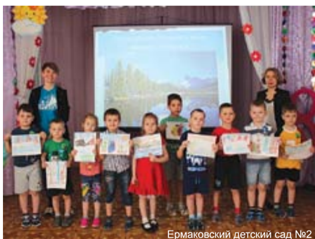
Ермаковский детский сад №2