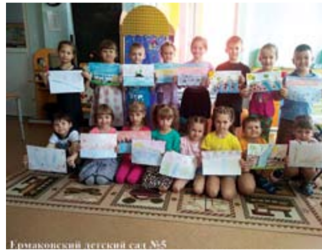
Ермаковский детский сад №5