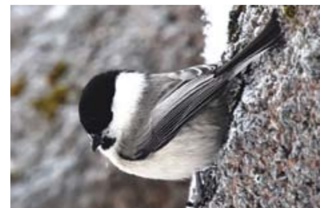
Буроголовая гаичка или пухляк.

Весной у этих пичуг можно наблюдать оживление, когда самец находит подходящее дупло и начинает петь рядом с ним, привлекая самку. Большие синицы очень плодовиты и многочисленны, и найти подходящее место для гнезда бывает непросто. Вот и приходится быть «экологически пластичными» - т.е. не просто неприхотливыми, а скорее расторопными, находчивыми и сообразительными. В лесу они занимают дупла, в том числе уже заселенные, беззастенчиво разоряя и выкидывая гнезда более мелких птиц, например, пестрых мухоловок. Чаще других они занимают скворечники, в том числе в многолюдных местах. Гнездятся в, казалось бы, совсем «неподходящих» местах - например, почтовых ящиках, фонарных столбах, пустотах различных строений и даже в железных трубах, вкопанных вертикально, и выполняющих функцию заборной