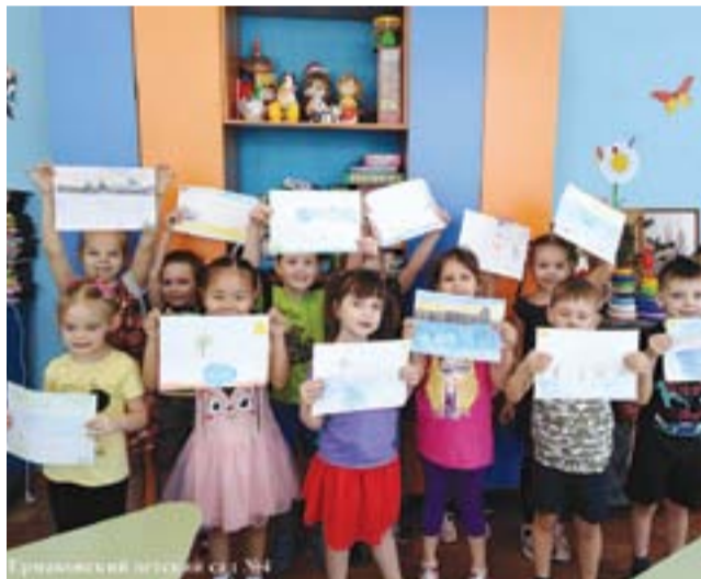
Ермаковский детский сад №1

Пресс-служба КГБУ «Дирекция природного парка «Ергаки»