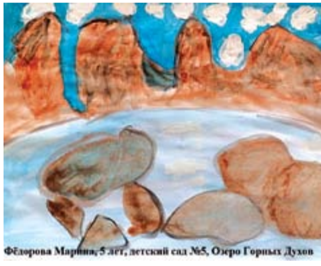
Фёдорова Маринна, 5 лет, детский сад №5, Озеро Горных Духов