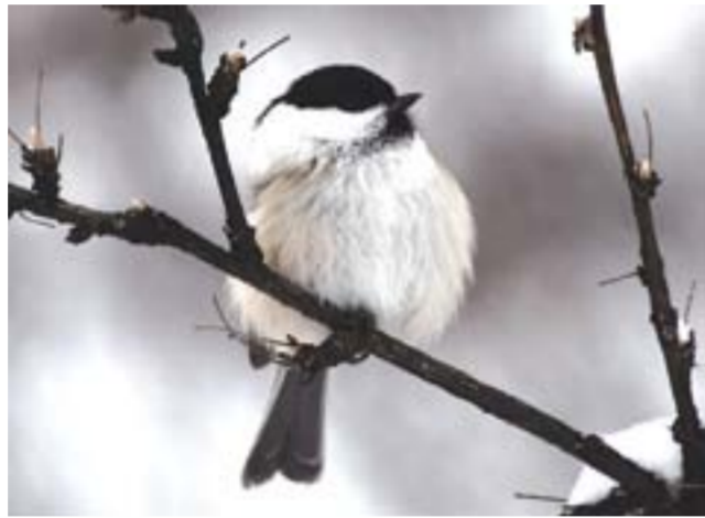
Буроголовая гаичка или пухляк.

suylus , в оперении которой синевы тоже достаточно много. Описывая внешний вид этой синицы, орнитологи, шутя, говорят, что это представитель благородного аристократического происхождения, т.е. «голубых кровей и белой кости», что соответствует окраске их оперения. Такую одну раз увидишь, больше никогда ни с кем не спутаешь.