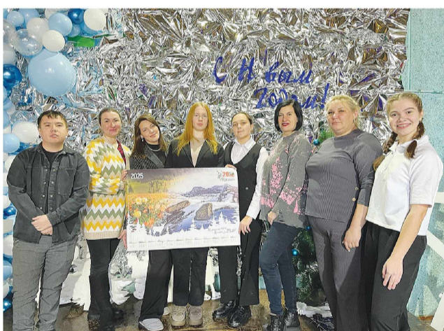
Молодёжный центр Звёздный