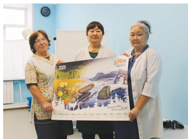
Верхнеусинская участковая больница