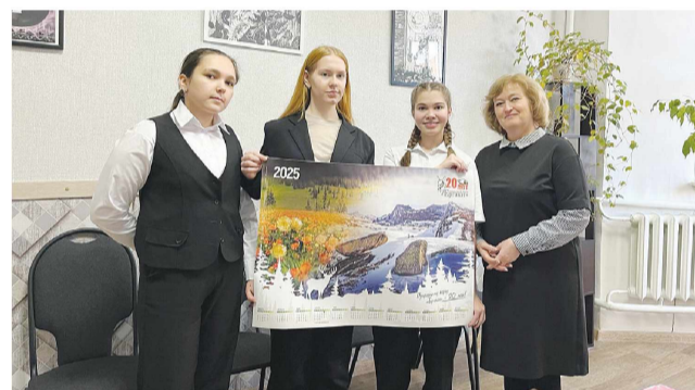
Отдел культуры администрации Ермаковского района