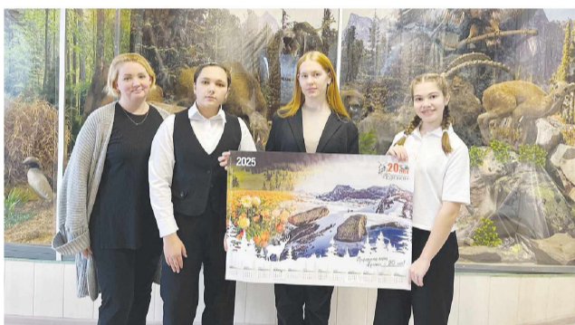
Музейно-выставочный центр с. Ермаковского