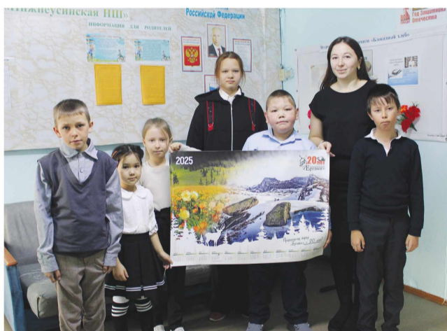
Нижнеусинская начальная школа