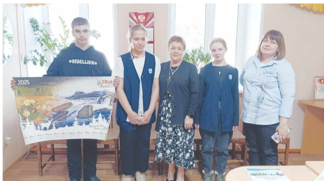
МБОУ «Ермаковская средняя школа № 1»

Дирекция природного парка «Ергаки» выражает благодарность всем ребятам и преподавателям, принявшим активное участие в этой акции.