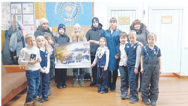
МБОУДО Ермаковская СЮТ