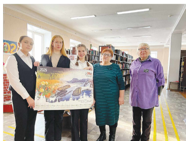
Ермаковская центральная библиотека