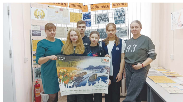
МКУ Архив Ермаковского района