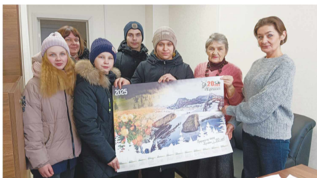
Редакция общественно-политической газеты НИВА