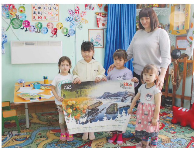
Нижнеусинский детский сад